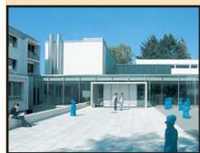
Un nouveau foyer pour le Conservatoire.